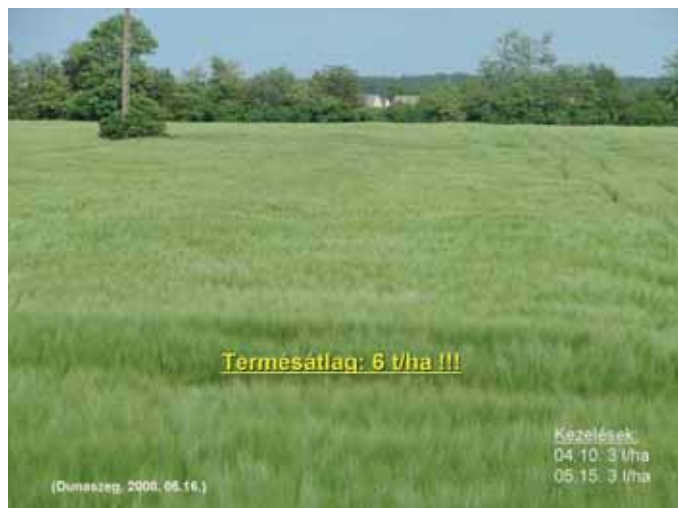
1. kép: SERGOMIL-L 60 kezelés eredménye legyengült, vírusfertőzött őszi árpában