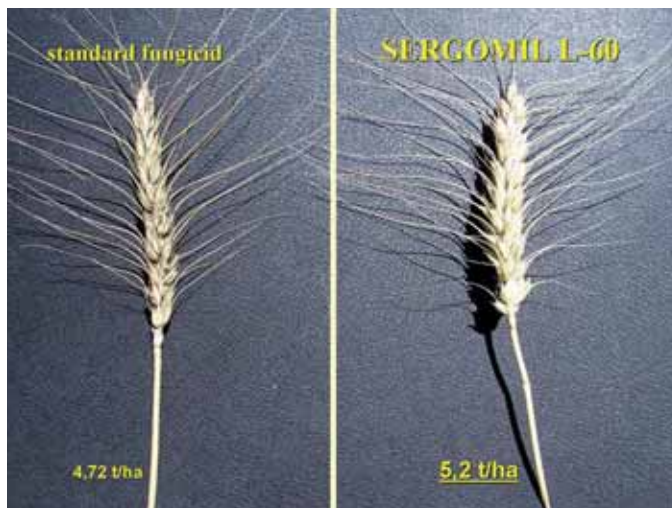
2. kép: SERGOMIL-L 60 kezelés hatása a korompenész okozta kalászfertőzésre

konyságán és kedvező tartamhatásán túlmenően különös előnye, hogy a Fusarium fajok toxintermelését (DON, ZEA) is jelentősen gátolja. A TOPSIN-METIL jelentőségét napjainkban tovább fokozza, hogy széles hatásspektruma mellett, eltérő hatásmechanizmusából adódóan a rezisztencia kialakulásának megakadályozásában is fontos szerepet játszhat. Különösen igaz ez az egyoldalú triazol , illetve strobilurin használat miatt elkerülhetetlen szerrotációra, ahol erre a célra korábban elterjedten használt benomil és a karbendazim hatóanyagú szerek EU visszavonásuk miatt ma már nem használhatók fel.